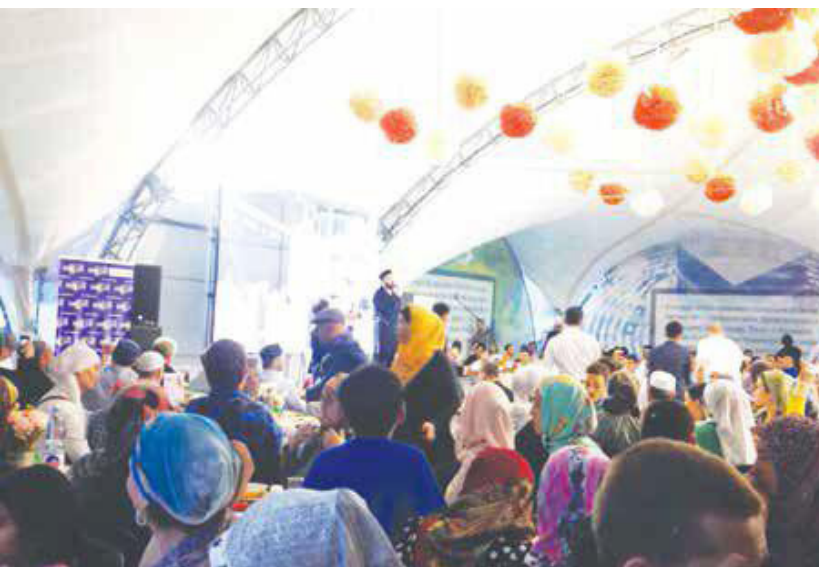
“Рамазон чорди”нинг очилиши ва унда қатнашиш

Кўзланган мақсадлар, жараёнларни амалга ошириш учун “Ал-Васатия” маркази шу кунгача бир қанча фикҳ, Куръон, тажвид йўналишлари бўйича ўқув курслари очишган ҳамда байрамлар ва сафарларни ҳам уюштириб улгуришган. Хусусан, икки ҳайит байрамлари, мавлид маросимлари, марказ қошида “Қувайт кунлари”нинг ташкил этилиши, Рамазон ойида “Рамазон чодири”нинг очилиши ва унда қатнашиш (айтиб ўтиш жоизки, бу кунларда болажонлар учун ҳам алоҳида байрамлар ташкил этилади), Халқаро “Ҳижоб куни” муносабати билан “Павлопасада рўмоллари” фабрикасига уюштирилган экскурсия ва ҳоказоларни мисол қилиб келтириш мумкин.